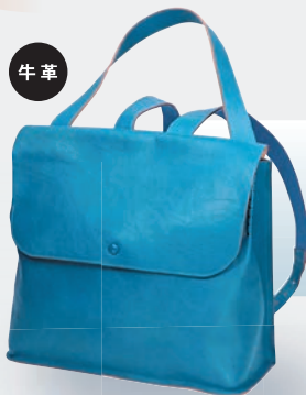
◀〈YUFU〉 レザーリュック 33,000円 (W27×H33×D12cm) ●革の仕入先 株式会社 金俊 (兵庫県姫路市)