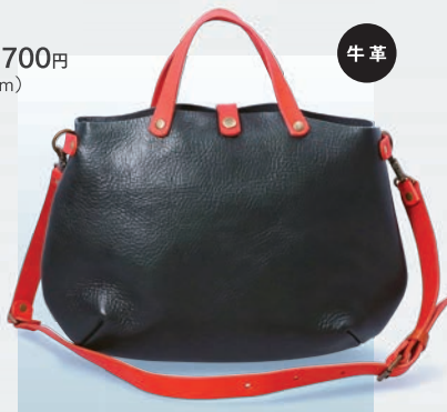
◀〈Foglia〉 ビジネスバッグ 74,800円 (W40.5×H30×D9cm) ●革の仕入先 株式会社 マルヒラ (兵庫県たつの市)