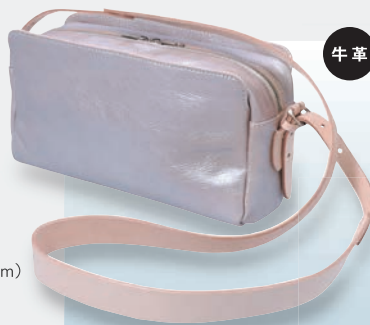
▲〈ANNAK〉 あおりポケットショルダーバッグ 35,200円 (W28×H16×D8cm) ●革の仕入先 VL.ナカシマ株式会社(兵庫県たつの市)