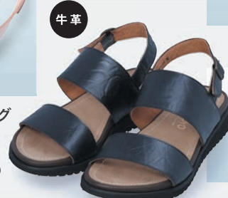
◀〈AshiOtO〉 2本ベルトサンダル 15,400円 (SS~XL) ●革の仕入先 株式会社 ヤマクニ(兵庫県たつの市)