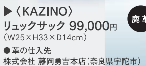
▶〈KAZINO〉 リュックサック 99,000円 (W25×H33×D14cm) ●革の仕入先 株式会社 藤岡勇吉本店(奈良県宇陀市)