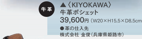
▲〈KIYOKAWA〉 牛革ポシェット 39,600円 (W20×H15.5×D8.5cm) ●革の仕入先 株式会社 金俊(兵庫県姫路市)