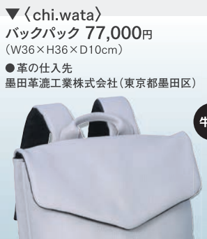
▼〈chi.wata〉 バックパック 77,000円 (W36×H36×D10cm) ●革の仕入先 墨田革漉工業株式会社(東京都墨田区)