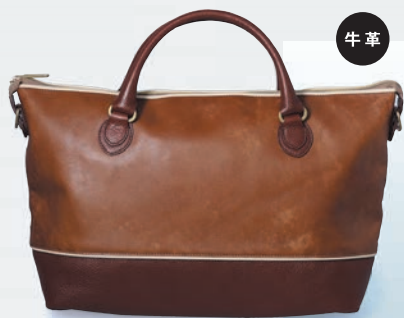
▲〈WOGNA〉 Transform 3スタイルトート 33,000円 (W33×H23×D4~13cm) ●革の仕入先 株式会社 モリヨシ(兵庫県たつの市)