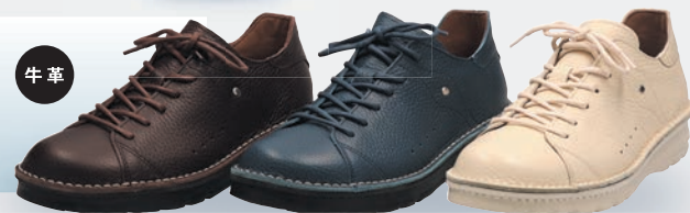
▶〈TODAY'S〉 4Eレースアップシューズ 各16,280円 (21.5~24.5cm) ●革の仕入先 松本静夫製革場(兵庫県たつの市)