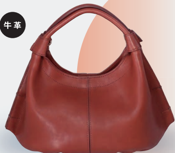
▲〈ANDERSEN BAG〉 ギザザーバッグS 50,600円 (W32×H15×D13cm) ●革の仕入先 中嶋皮革工業所(兵庫県たつの市)