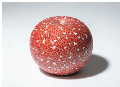
7 「希赤 輝咲」 825,000 円