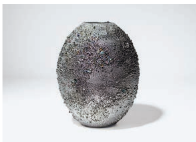
3 「Aurora 凜輝」 1,485,000 円