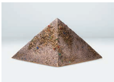
4 「Aurora Pyramid (Gold)」 1,650,000 円