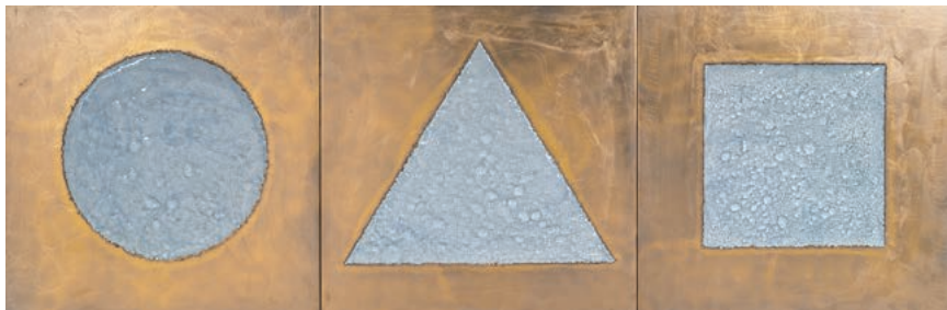
1 「〇△□」 7,700,000 円