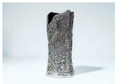
5 「Aurora 清輝」 1,210,000 円