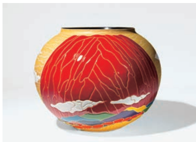
6 「希赤 赤富士」 4,400,000 円