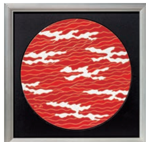
8 「Circle of light」 935,000 円