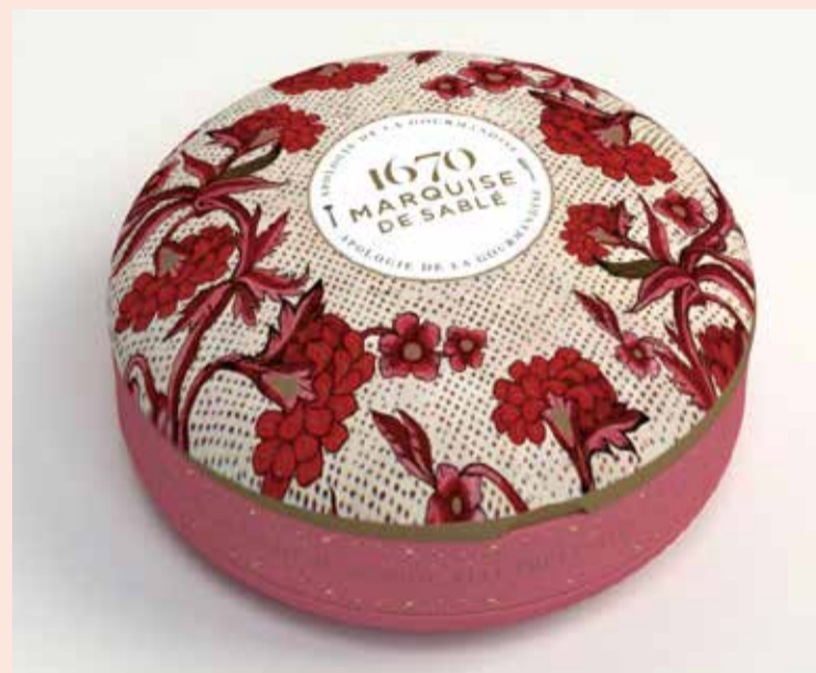
〈ラ・サブレジエンヌ〉 1670ラウンド缶茜色の夢