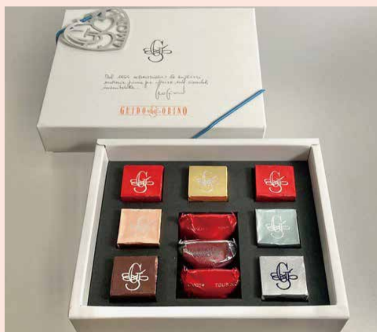
〈ガイドゴビーノ〉 ガイドホワイト10