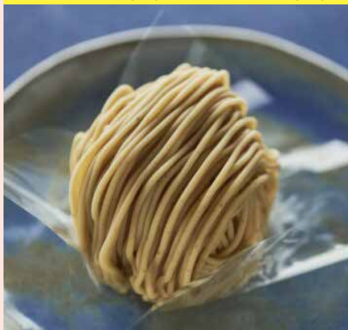
〈小布施堂〉 モンブラン