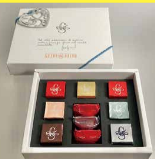
〈ガイドゴビーノ〉 ガイドホワイト10