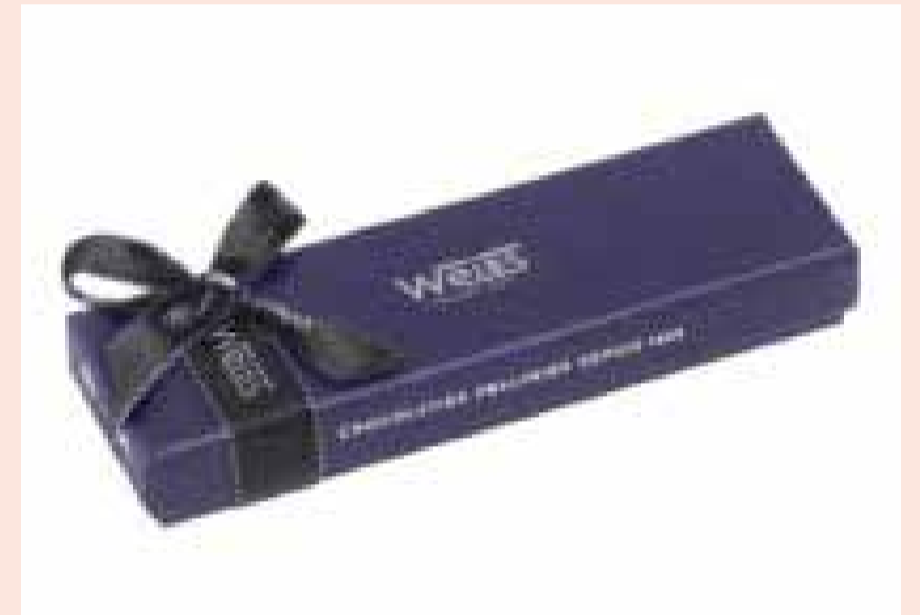
〈WEISS〉 ボンボンショコラアソート 5粒入り