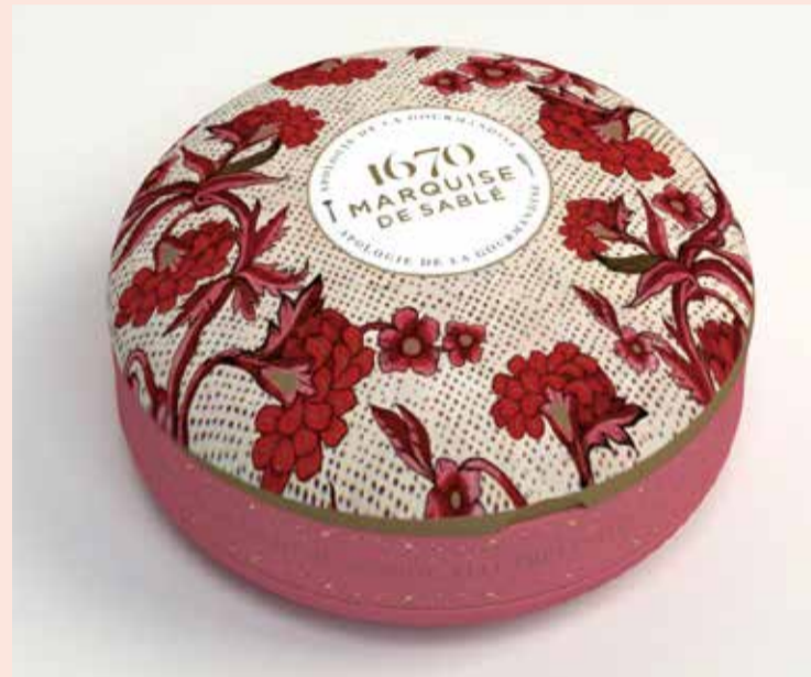
〈ラ・サブレジエンヌ〉 1670ラウンド缶 茜色の夢