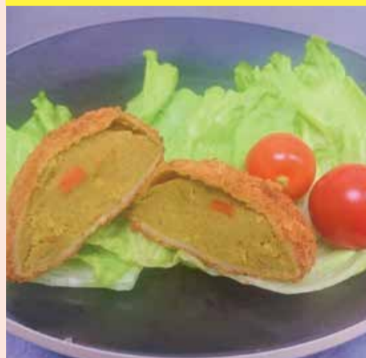
〈イリプス〉 よこすか海軍 カレーコロケ