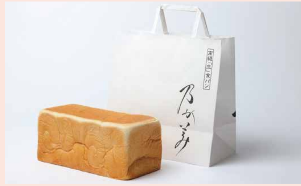
〈高級「生」食パン専門店乃が美〉 創業乃が美