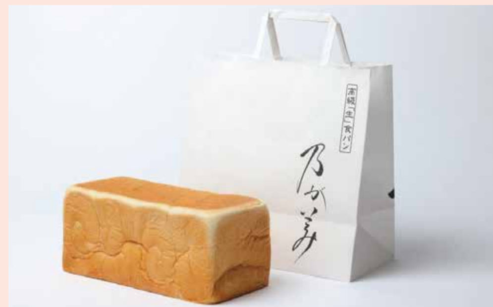
〈高級「生」食パン専門店乃が美〉 創業乃が美