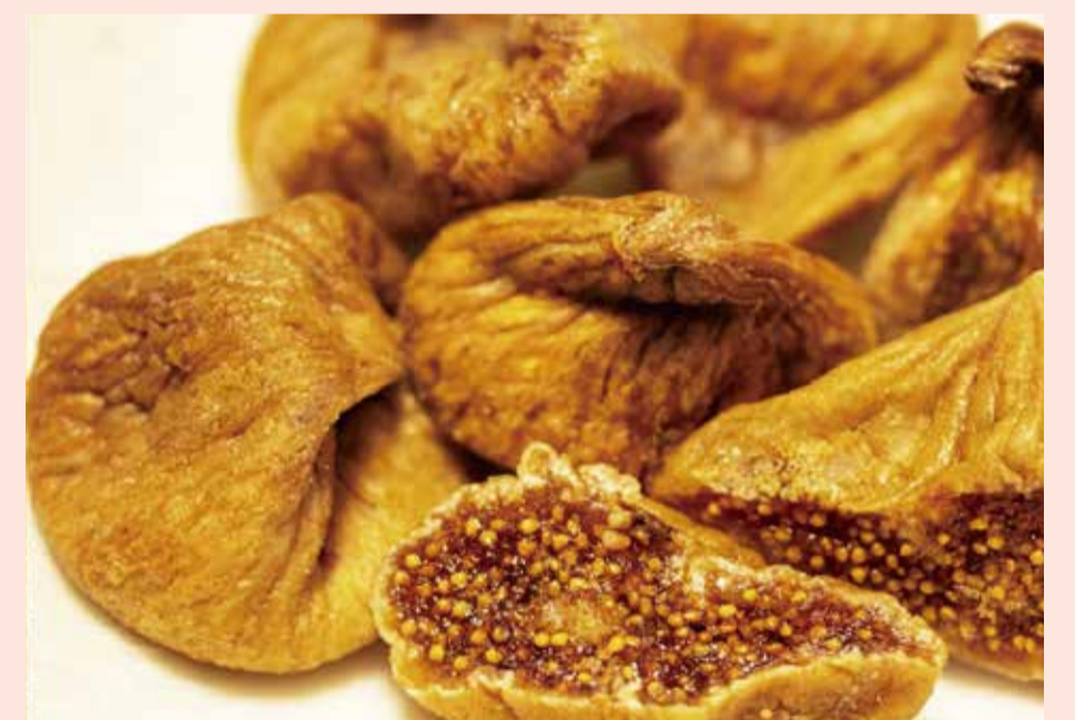
〈プログレ〉いちじく