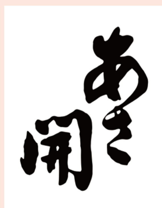
〈岩手県/あさ開〉 あさ開