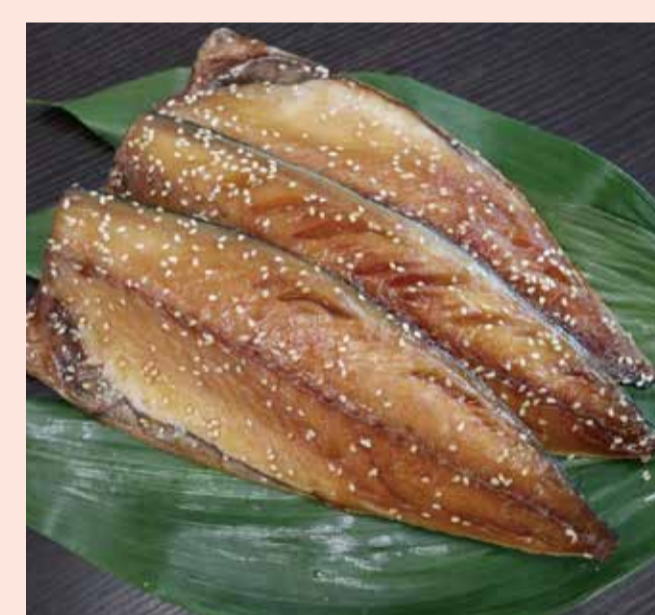
〈魚恵〉 とろさばみりん