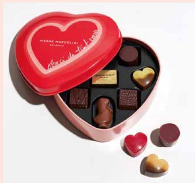
〈ピエール マルコリーニ〉 コフレ クール 9個入り