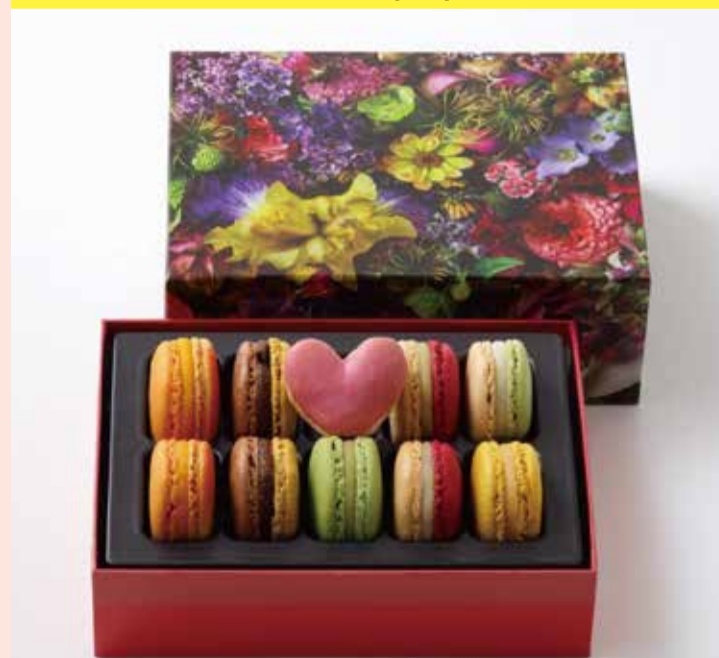
〈ピエール・エルメ・パリ〉 マカロン