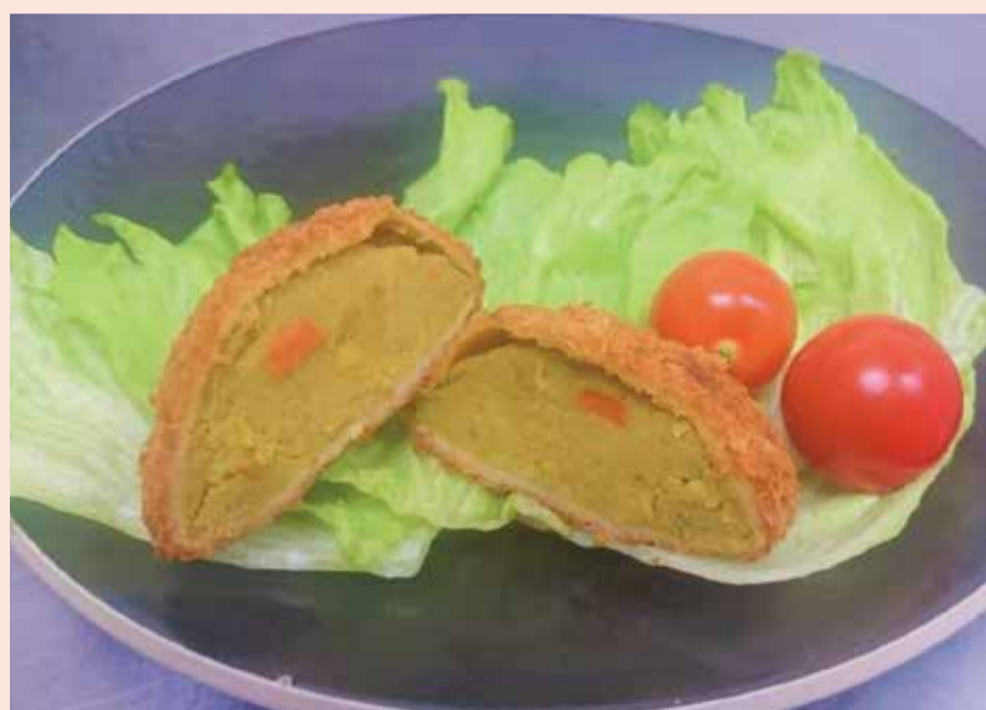
〈イリプス〉 よこすか海軍カレーコロッケ