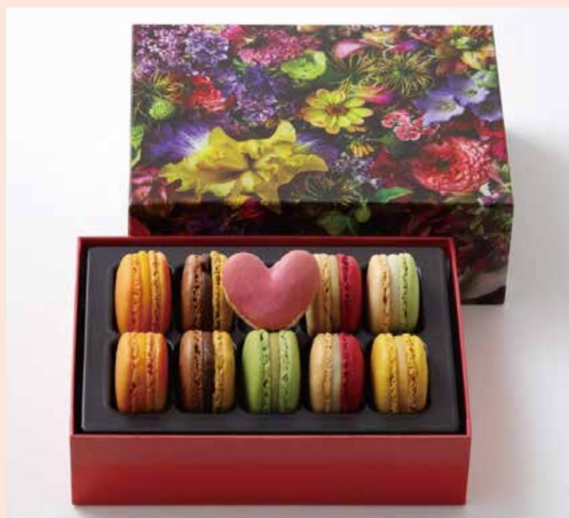
〈ピエール・エルメ・パリ〉 マカロン