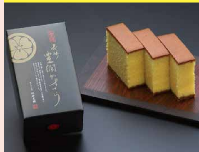
〈松井老舗〉 五三焼長崎 豊潤カステーラ