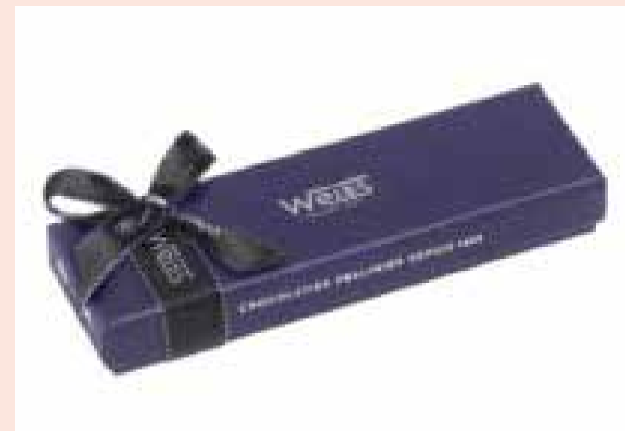
〈WEISS〉 ボンボンショコラアソート 5粒入り