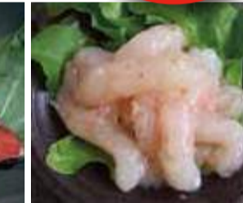
甘えびのプリッとした食感と甘みは そのままに米で漬けた一品。 〈海鮮珍味 海宝〉 甘えび塩辛(100g) 780円