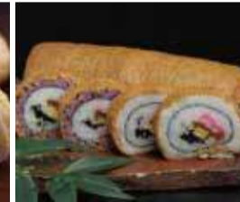
栃尾名産のあぶらげで巻い た太巻寿司。 〈たから寿司〉 あぶらげ巻寿司(5個入) 918円