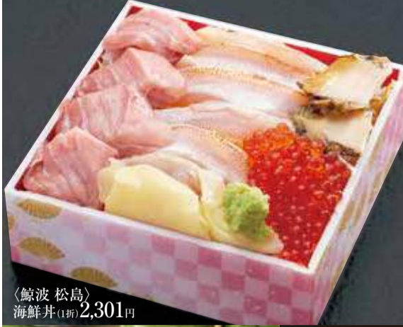
〈鯨波 松島〉 海鮮丼(1折) 2,301円