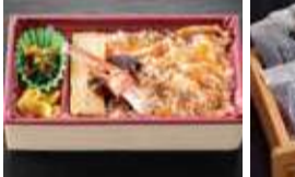
焼きがにの風味豊かな 弁当。 〈旬食 吉里〉 焼きがにめし(1折) 1,381円