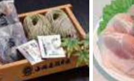
厳選した玄そばと海藻 の布乃利(ふのり)を使用。 〈小嶋屋総本店〉 布乃利生そば (2人前) 1,512円