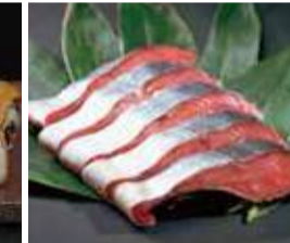
村上岩船港で水揚げされた 天然秋鮭をじっくりと熟成。 〈サーモンハウス〉越後村上 寒風造り 塩引き鮭(3切) 1,188円