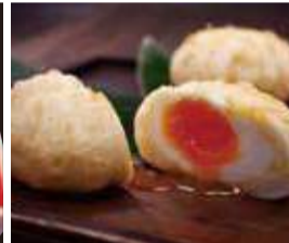
ふわふわの生地にとろりとした 半熟煮玉子がまるごと入りました。 〈竹徳かまぼこ〉 煮玉子しんじょう(1個) 368円