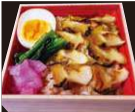
佐渡の特Aコシヒカリと佐渡産の サザエを使用した磯の香る弁当。 〈あるこーいす〉 佐渡さざえめし(1折) 864円