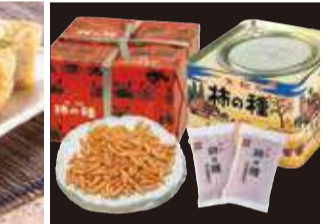
伝統の味とデザインの元祖 柿の種。 〈浪花屋製菓〉柿の種進物缶 (27g×12袋) 1,080円