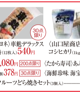
〈マルヨネ〉車麩デラックス 1本巻(12枚入) 540円