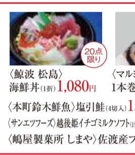
〈鯨波 松島〉 海鮮丼(1折) 1,080円