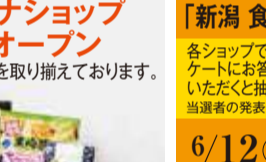
新潟アンテナショップ 期間限定オープン お土産などに人気の商品を取り揃えております。

「新潟 食の祭典」お買上げキャンペーン 各ショップでお買上げの際に抽選用紙をお渡しします。アン ケートにお答えいただき、会場内の抽選ボックスに投函して いただく抽選で45名様に米など新潟県産品が当たります。 当選者の発表は賞品の発送をもってかえさせていただきます。