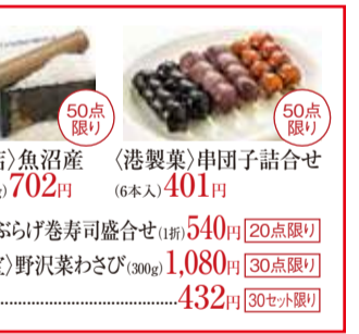
〈山口屋商店〉魚沼産 コシヒカリ(1kg) 702円