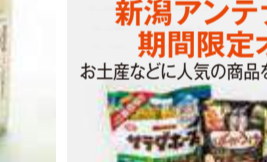
新潟米にこだわり、砂糖・香料・ 着色料を使用しない自然の味。 〈三崎屋醸造〉 特別栽培米コシヒカリあまざけ (740g) 2,268円