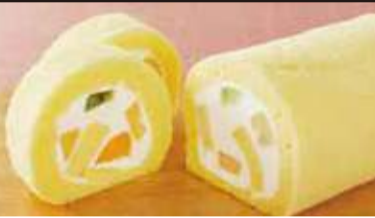
〈嶋屋製菓所 しまや〉 佐渡地鶏ひげ卵の フルーツロール (1本・18cm) 1,404円

6/12(水) ↓ 18(火) 仙台三越 本館7階ホール 【最終日は午後6時に終了】