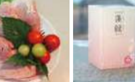
山桜の原木で燻した 香りとお味の一品。 〈なかよしミート〉 山桜いぶし骨付モモハム (100gあたり) 692円