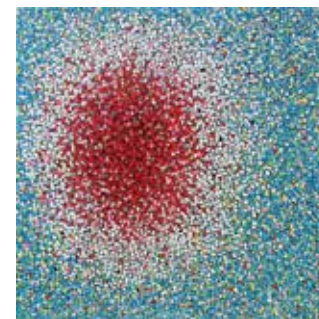
46 「Unlimited2313」 S4号 キャンバスに油彩、木炭 264,000円