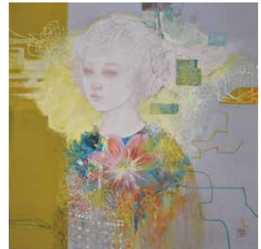
7 「記憶に刻む前と後」 S10号 550,000円