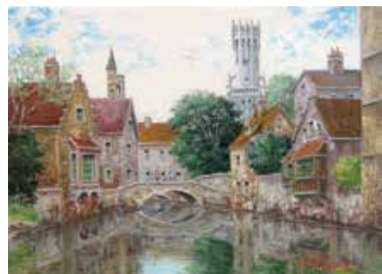
40 井口 由多可「ブルージュ新緑」 4号 油彩 352,000円