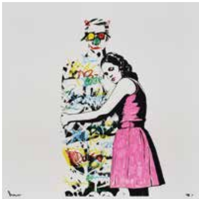
53 ドルク 「Toy tags pink」 65×65cm マーカー+シルクスクリーン 1,980,000円