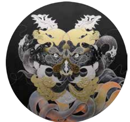
56 HAMADARAKA 「GALA」 Φ100cm ミクストメディア 675,000円