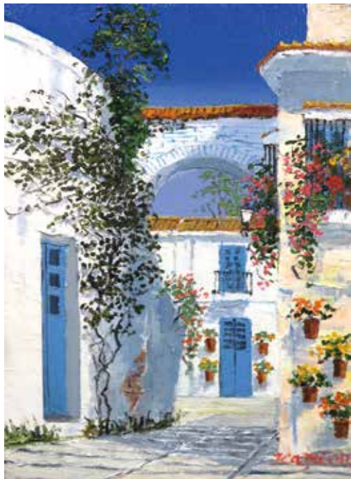
38 森下 一夫「白い村」 4号 油彩 176,000円

街角の詩情、佇まいの歴史、四季折々の美しい自然との出会いと感動。 胸に焼き付けたあの日の風景をご堪能くださいませ。