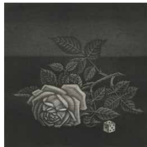
63 長谷川 潔「薔薇」 1963年 14×14cm 自筆サイン入り マネエール・ノワール 880,000円