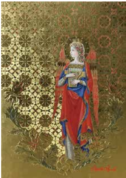
30 大垣 早代子 「奏楽の天使(プサルテリウム)」 F4号 264,000円

オリジナリティーとアイデンティティー。個性豊かに、自身の内面と対話しながら 現代洋画壇で活躍する画家たちの競演です。