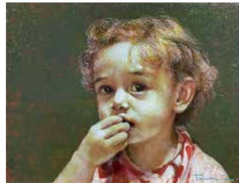
34 竹内 康行「少女」 F6号 528,000円