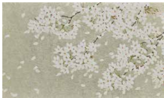
26 楚里 勇己「シロイハナ サダイロ」 M8号 日本画 440,000円