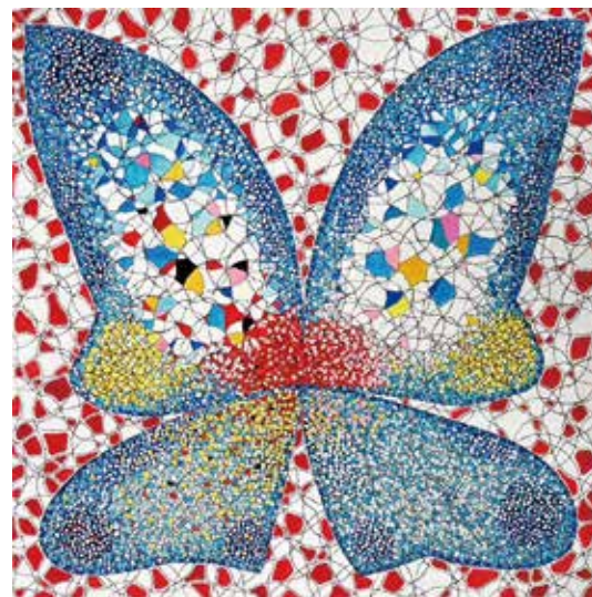
43 「Butterfly23-12」 S10号 キャンバスに油彩、木炭 660,000円

私が創作する上で大切にしていることは、「オリジナルであること」です。世界中のどこで目にしても内田江美の作品だとわかる。そんな表現を目指しています。 内田江美