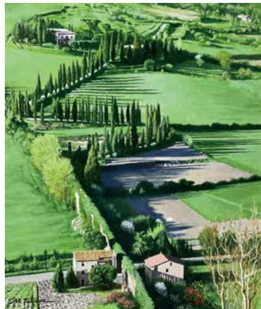
36 「糸杉の道(オルビエート・イタリア)」 F10号 660,000円