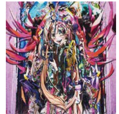
59 梅沢 和木 「plan 888」 55.5×55.5cm アクリル+紫外線硬化樹脂 990,000円