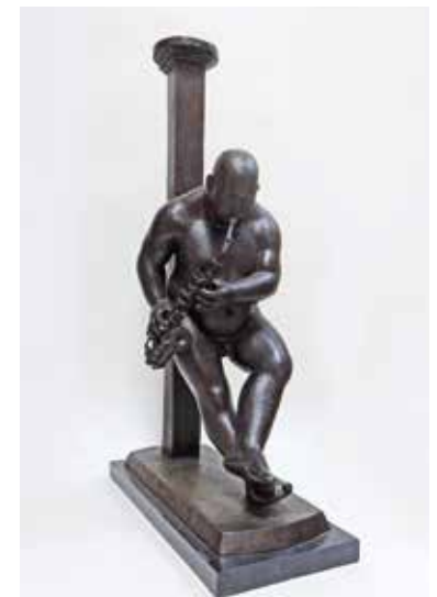
70 黒川 晃彦 「柱にもたれてアルトを吹けば・・・」 ブロンズ H76.5×W20×D47cm 1,430,000円