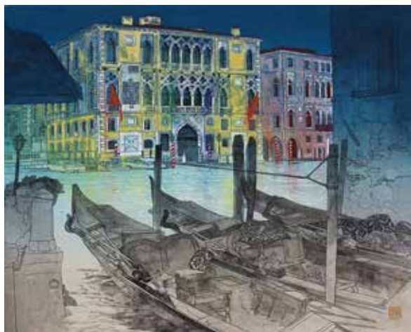
20 宮下 真理子「水路の彩り」