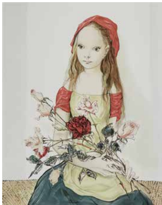
61 レオナルド・フジタ「薔薇を持つ少女」2023年 40×31.8cm リトグラフ 308,000円