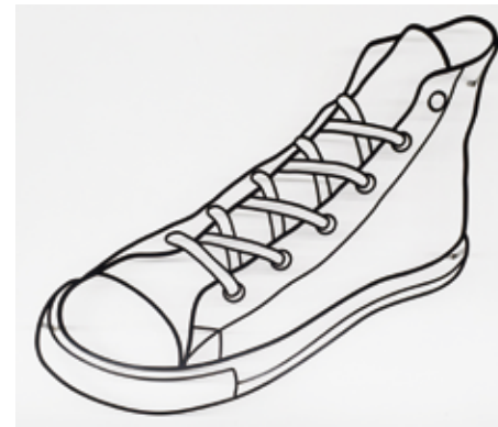
58 今井 みのり 「sneakers」 62×77×7cm 熱間手曲げ加工+溶接+ウレタン塗装+鉄+ステンレス 396,000円