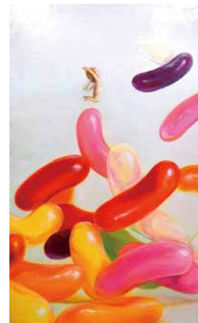
17 青山 ひろゆき「はじける」 M8号 油彩 264,000円