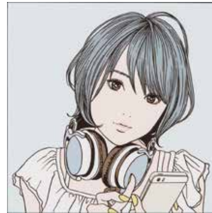
55 江口 寿史 「LISTEN TO THE MUSIC 3」 31.2×31.2cm ジークレー 242,000円