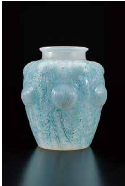
67 ルネ・ラリック 花瓶「ドンレミ」 H21.2cm 880,000円