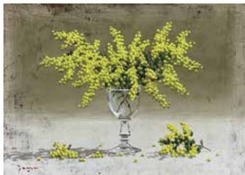
33 玉田 健二「ワイングラスとミモザ」 F4号 286,000円