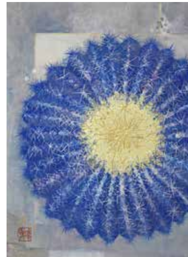
6 「美しい鎧」 F4号 264,000円