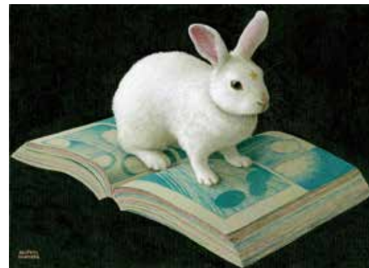
16 奥村 晃史「Psyched!」 F4号 油彩 330,000円