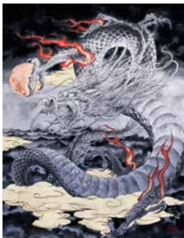
21 川又 聡「雲龍」