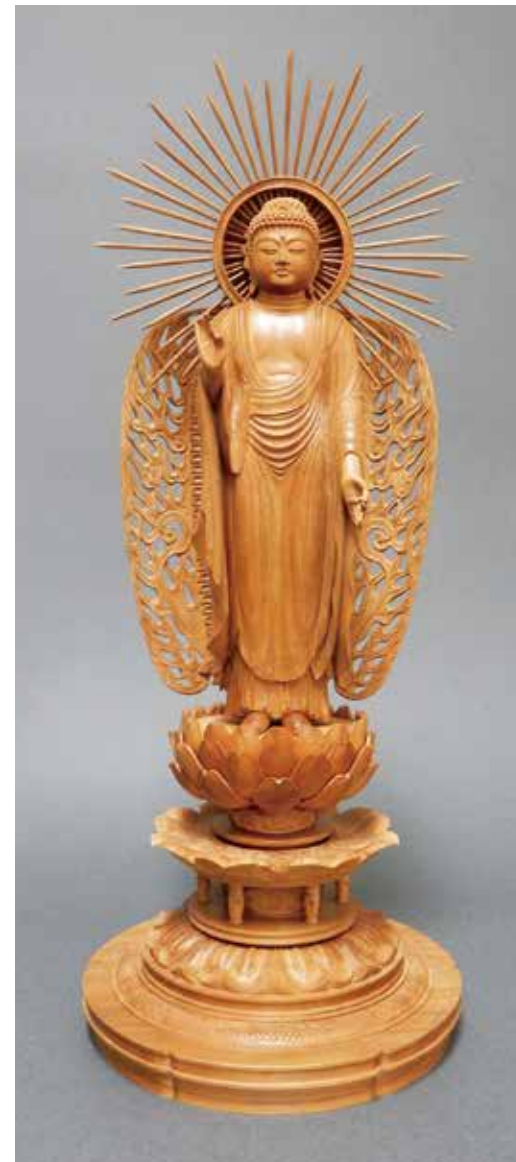
68 向吉 悠睦「阿弥陀如来」 白檀 H30.5×W12×D12cm 4,730,000円

己の内面と向き合い一心に彫り込む作品には、生命の息吹が宿っており、その圧倒的な存在感は、観るものを魅了します。