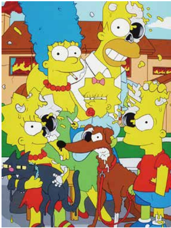
52 マット・ゴンドク 「BROKEN FAMILY」 61×48.4cm ジークレー 660,000円