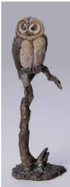
73 「ふくろう」 H38×W13×D11cm 1,430,000円