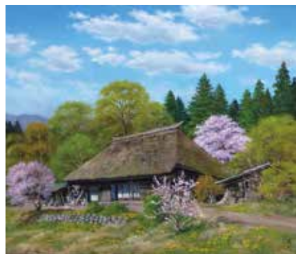
42 雨宮 英夫「訪春民家(宮城県大崎市)」 10号 油彩 495,000円