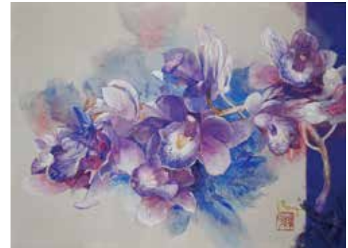
4 「妖艶なダンス」 F4号 264,000円