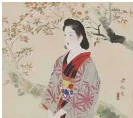
8 伊藤 深水「花陰」 46.2×51.4cm 4,400,000円

日本画の文化勲章作家、文化功労者、日本藝術院会員の先生方を中心に 歴史に大きな足跡を残した近代巨匠作家 現在の日本画壇の中核で活躍されている現代巨匠作家の作品を一堂に展覧いたします。 巨匠たちが奏でる「気品」と「雅趣」をご満喫ください。