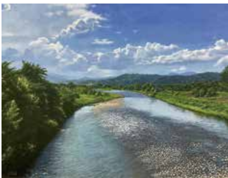
32 杉浦 幹男「遥(寒河江川・山形)」 F6号 396,000円