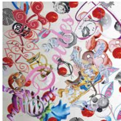
54 chihirobo 「paris dots #004」 S15号 フォトコラージュ 220,000円