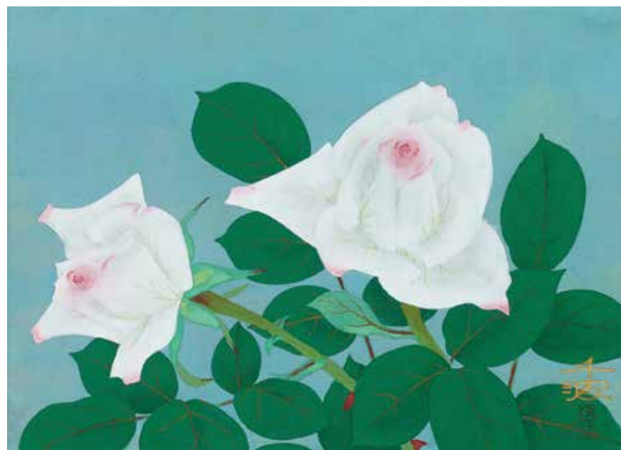
12 中島 千波「白ばら」