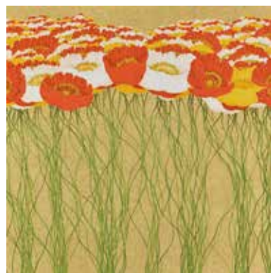
27 楚里 勇己「イロノツラナリ」 S25号 日本画 990,000円