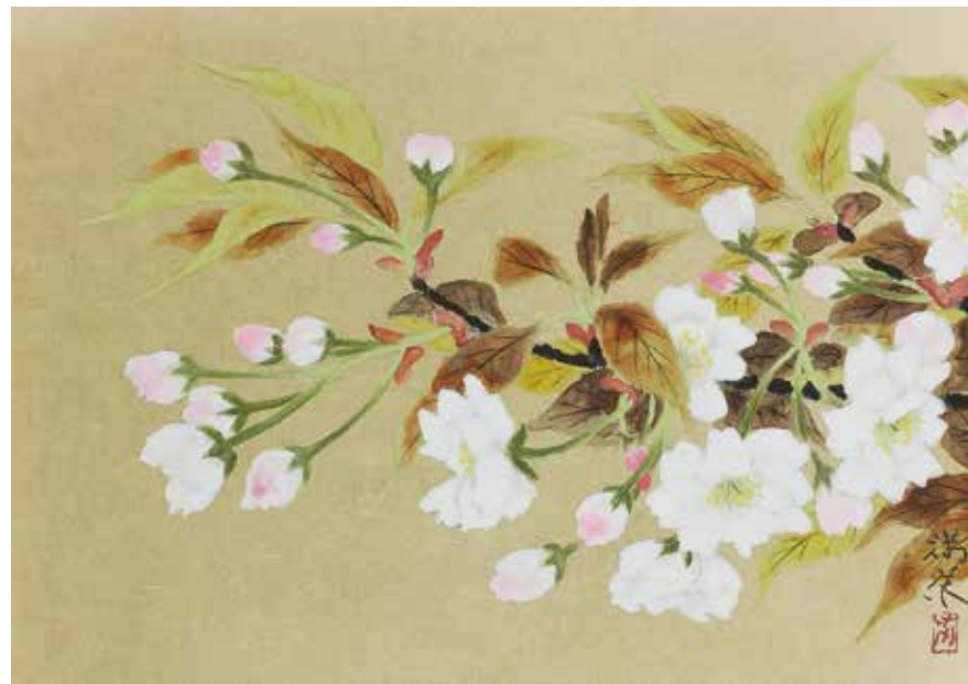
11 齋藤 満栄「八重桜」