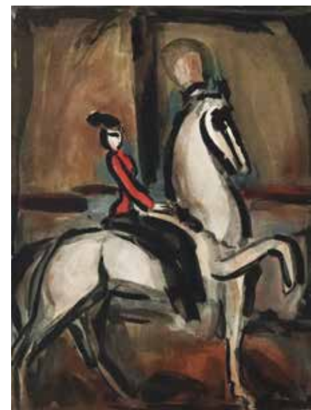
64 ジョルジュ・ルオー 「サーカスより アマゾン」 1930年 29.5×22.5cm アクアチント 880,000円