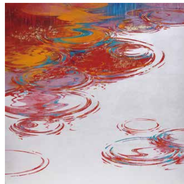
18 坪田 純哉「舞曲」 S6号 岩彩 308,000円