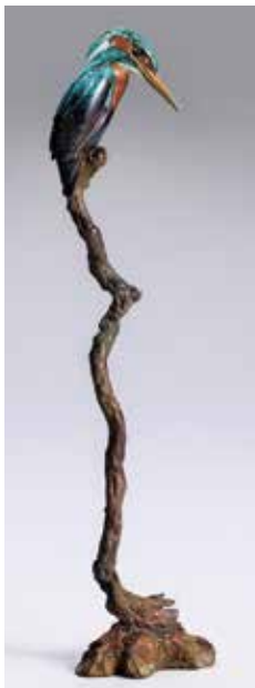
74 「Nerai(かわせみ)」 H24×W6.4×D4.5cm 275,000円