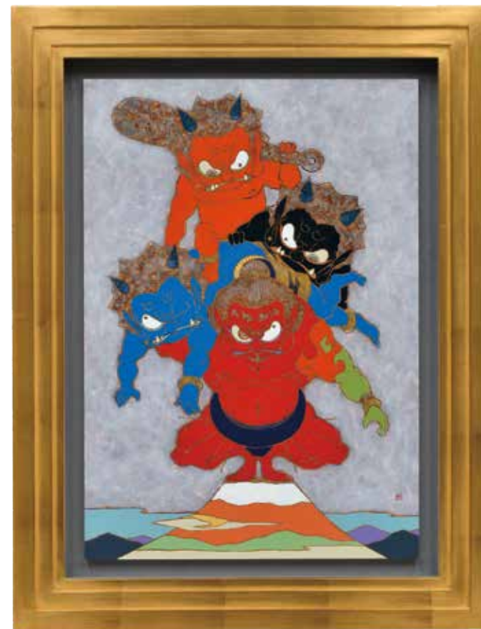
28 瀧下 和之「富嶽大相撲力士図」 M15号 アクリル 1,485,000円