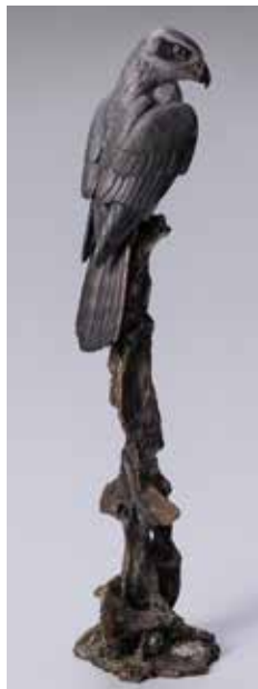
71 「おおたか」 H33×W8×D7.5cm 1,155,000円

鳥を中心に動物や昆虫などを温かな目線で見つめ続け、細部まで精巧に表現するオランダ出身の金工作家、ヘンク・フレイスン氏。金属本来の発色を生かしたものから、絵付けを施した色鮮やかなものまで、多彩な世界観をお楽しみください。