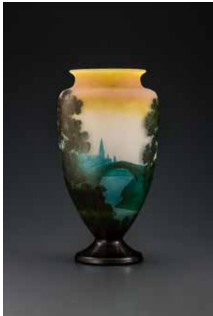
66 ガレ「風景文花瓶」 H31.9cm 2,200,000円