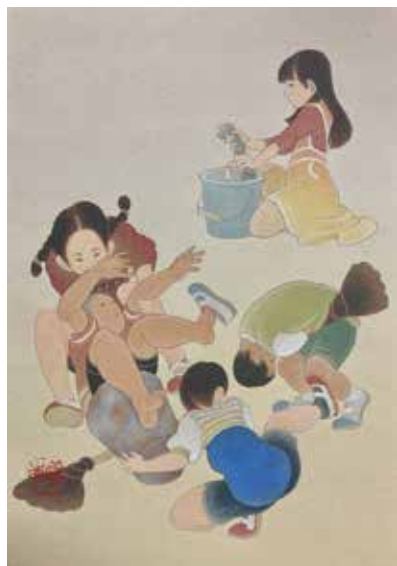
13 熊谷 曜志「そうじの時間」 SM 岩彩 132,000円

伸びやかな感性に満ちた俊英たち、独創性豊かな煌びやかな才能たちの競演をご体感くださいませ。