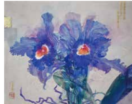
3 「共存する魅力」 F6号 330,000円