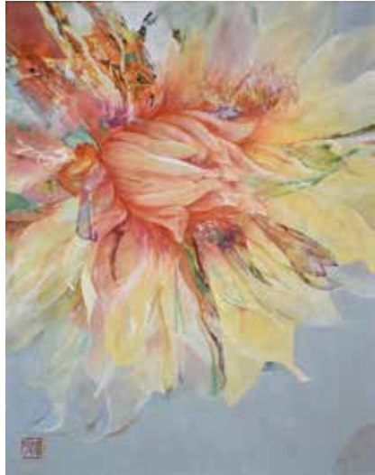
1 「満面の美」《表紙掲載作品》 F6号 330,000円