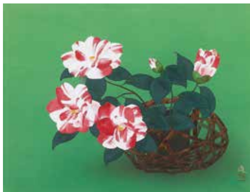
9 牧 進「春望」 6号 3,960,000円