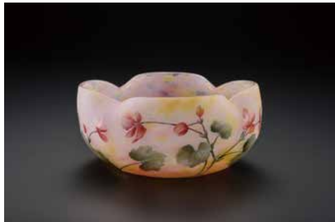
65 ドーム「ベゴニア文鉢」 H8cm 1,210,000円

ガラスの輝きの内に秘められた自然賛歌、ジャポニズム、博物学、そして時代の香り。今なお美術ファンを魅了し続けている輝きです。