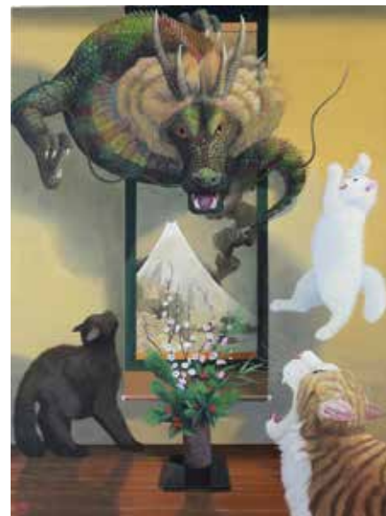
22 松本 亮平「富士越龍図」