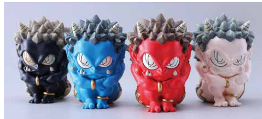
29 瀧下 和之「体育座り(黒・青・赤・白)」 各H11.5×W8×D8cm フィギュア 各39,600円