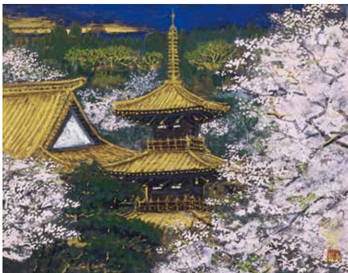
10 後藤 純男「春映大和」 6号 3,300,000円