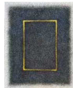
44 「Trace23-15」 F15号 キャンバスに油彩、木炭 891,000円

2016年 台湾/台北・台北101タワー 個展 他 ヨーロッパ、アメリカ、メキシコ、トルコ、シンガポール、その他アジアのアートフェア、国際展、個展多数。国内では、各地の百貨店、ギャラリーでの個展多数。