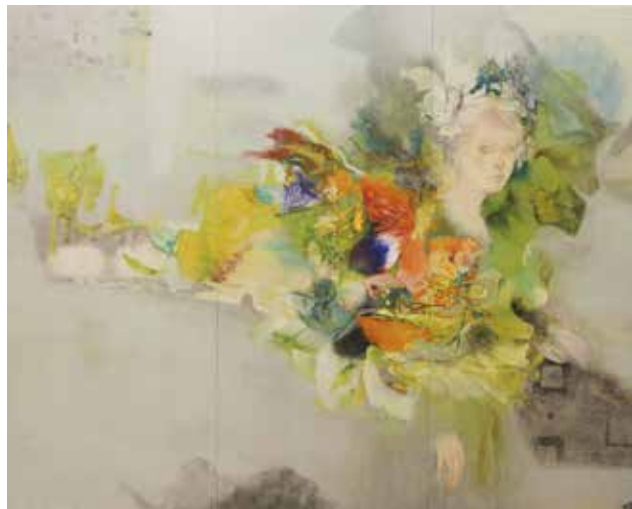
2 「かけらのかさなり」 170×215cm 4,950,000円