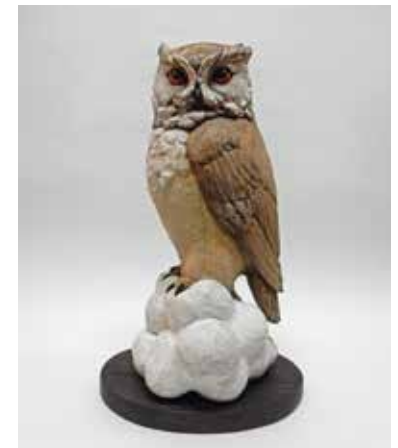
69 秋山 隆「雲を掴む」 樟 H33×W20×D17cm 385,000円