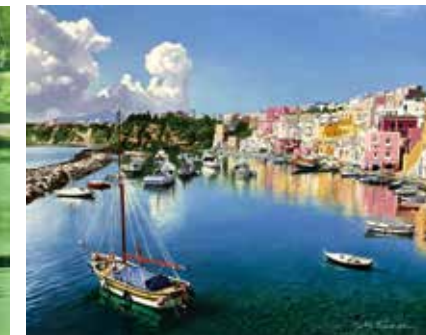
37 「春の漁港 (プロチダ・イタリア)」 F15号 990,000円