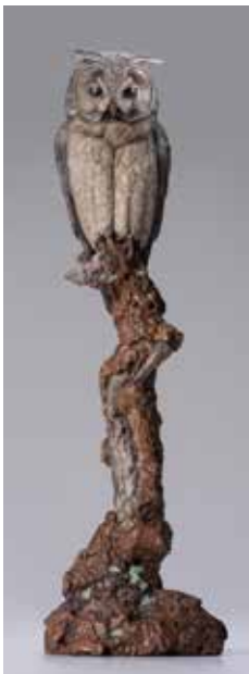
72 「みみずく」 H31×W10×D10cm 1,100,000円