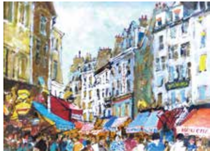
39 児玉 幸雄「ムフタル通り」 F4号 油彩 2,200,000円