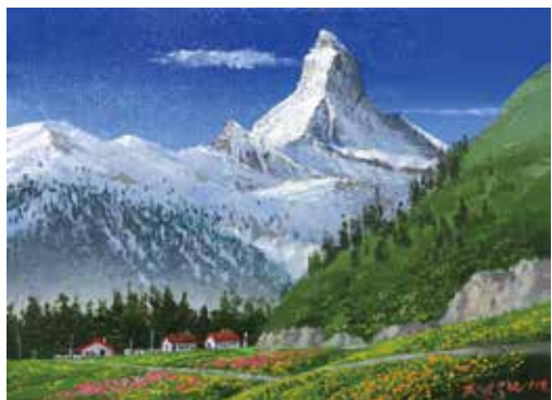
41 森下 一夫「マッターホルン」 4号 油彩 176,000円