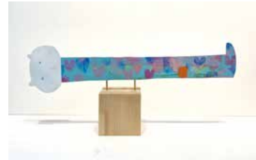
57 サイトウ ノリコ 「ひるねどき」 27.4×63×12cm 銅板+アクリル+木 165,000円