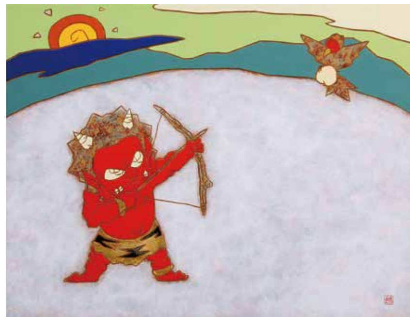
24 瀧下 和之「桃太郎図ノ祭典 鬼ヶ島でねらいうち。」