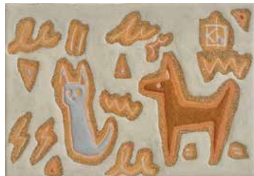
14 杉山 佳「猫に助けられる」 SM 岩彩 132,000円