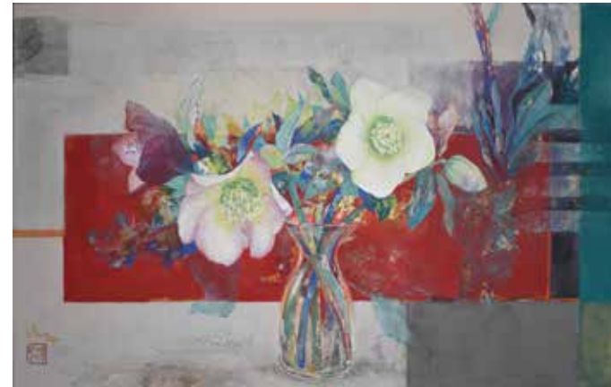
5 「有機と無機のリズム」 M10号 550,000円