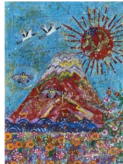
35 村岡 顕美 「赤富士」 F4号 220,000円