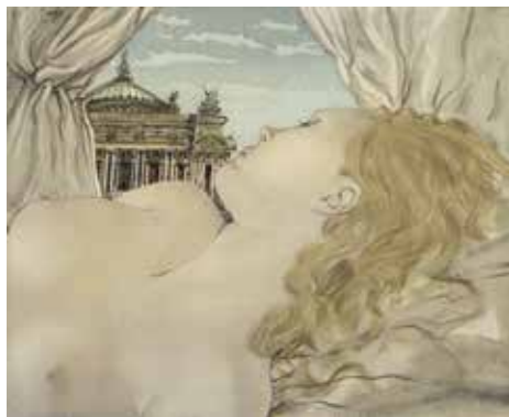
60 レオナルド・フジタ 「魅せられし河 オペラ座の夢」 1951年 23.5×28.7cm エッチング・手彩色 5,390,000円

100年前、芸術の都パリで活躍した画家たちの軌跡を版画を通して巡ります。20世紀前半のパリを舞台に活躍した芸術家たちは、エコール・ド・パリ(=パリ派)と呼ばれました。彼らの独創的な活動は、芸術の都パリをより自由な創造の場へと高め、それぞれ個性豊かな世界が切り開かれていきました。異国の空の下に暮らす芸術家たちのアイデンティティと古今東西の文化の融合、その魅惑的な表現世界を、彼らが情熱を注いで制作した版画を通してご紹介いたします。