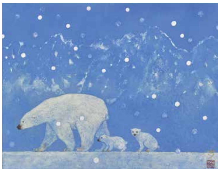
15 松岡 歩「旅」 F6号 岩彩 660,000円