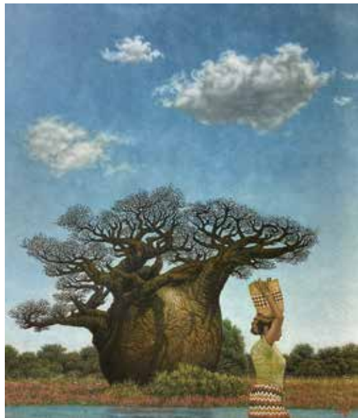
31 佐藤 秀人「バオバブとサンゴソウ」 F10号 770,000円