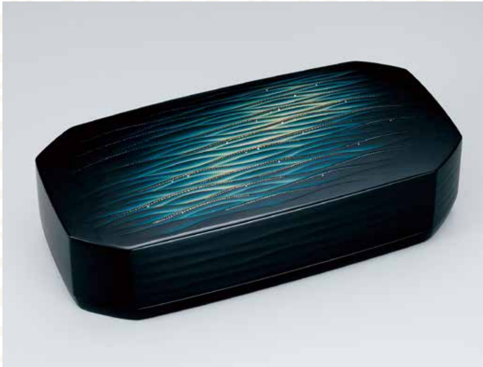
日本工芸会総裁賞

※三越伊勢丹グループはサステナビリティ活動の一環として「日本伝統工芸展」を開催し、芸術振興に取り組んでいます。