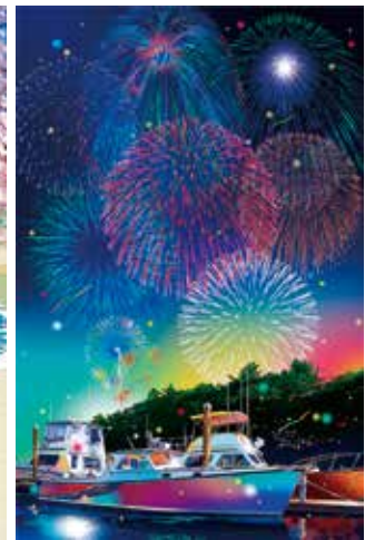
瞬く火の花 税込242,000円 (63.9×41.4cm E.M.グラフ)