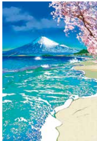
湘南の春 税込242,000円 (62.0×42.9cm E.M.グラフ)