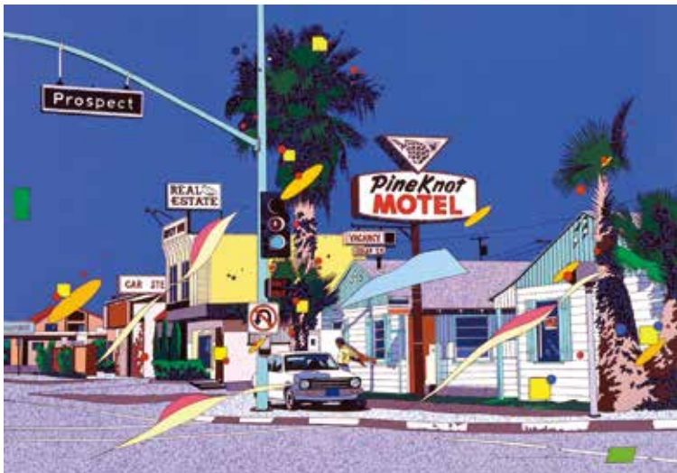
〈原画〉パイン ノット モーター 税込1,980,000円(36.7×51.5cm)