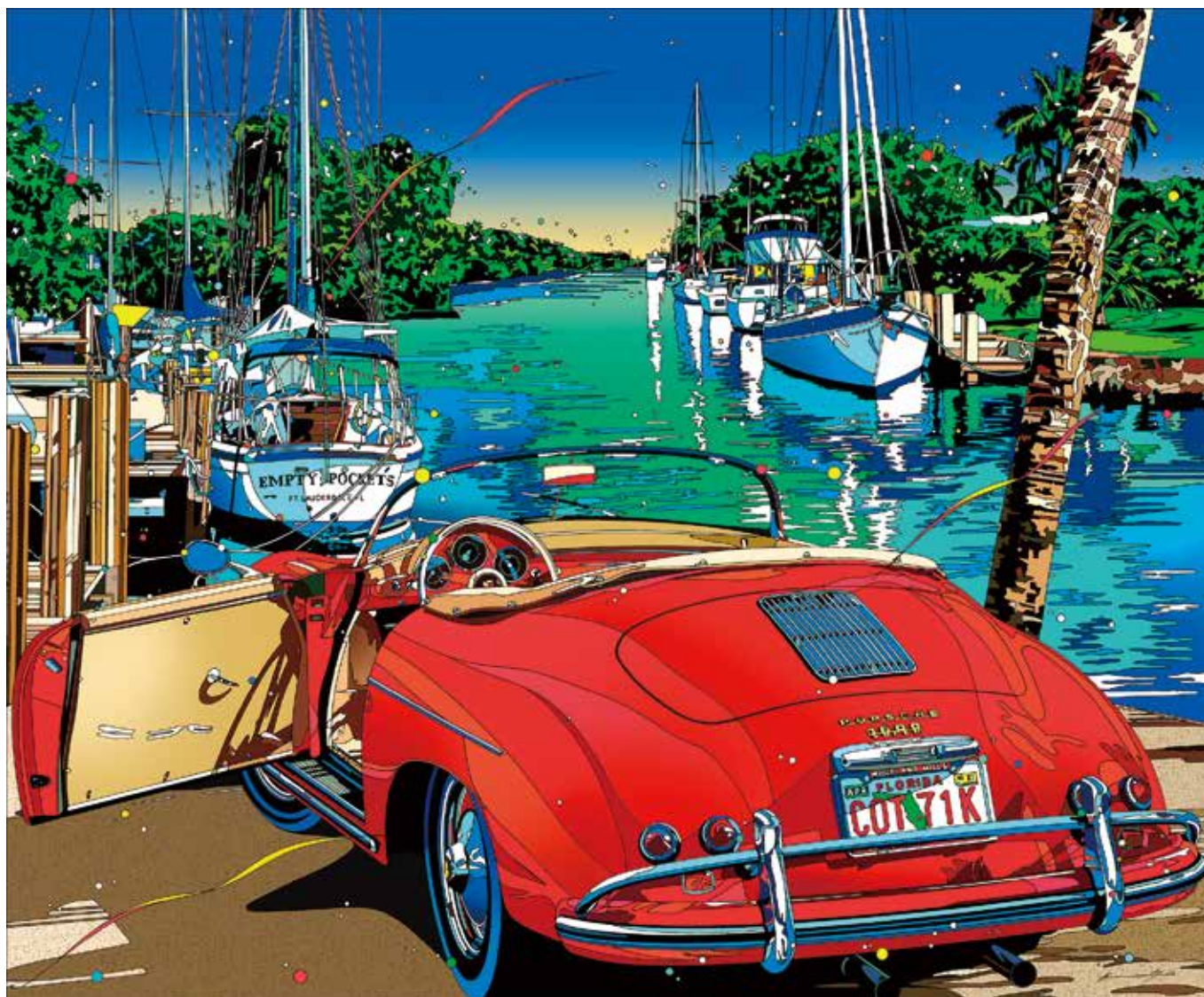
フォーエバー マイフレンド 2 税込242,000円(47.1×57cm E.M.グラフ)

10/12(水)→18(火) 仙台三越 本館7階ホール 最終日は午後5時に終了。