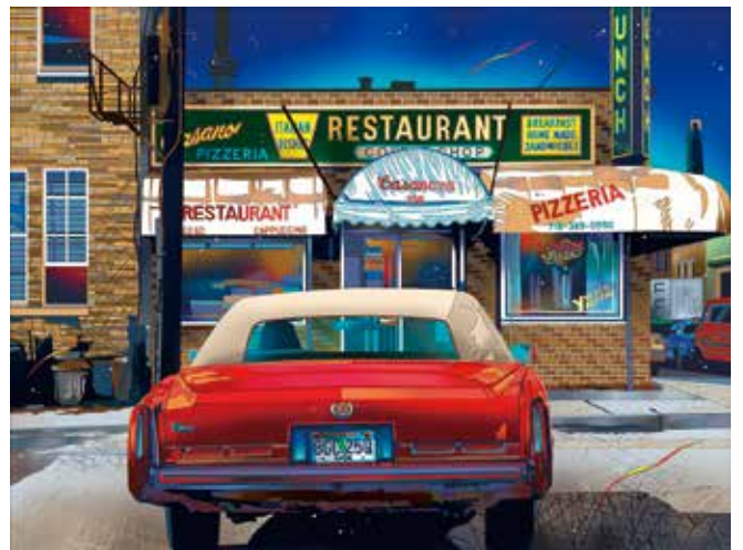
カサノバの朝 税込242,000円(45.3×58.9cm E.M.グラフ)

A4 変形版(280×210mm) 208ページ オールカラー 税込3,960円