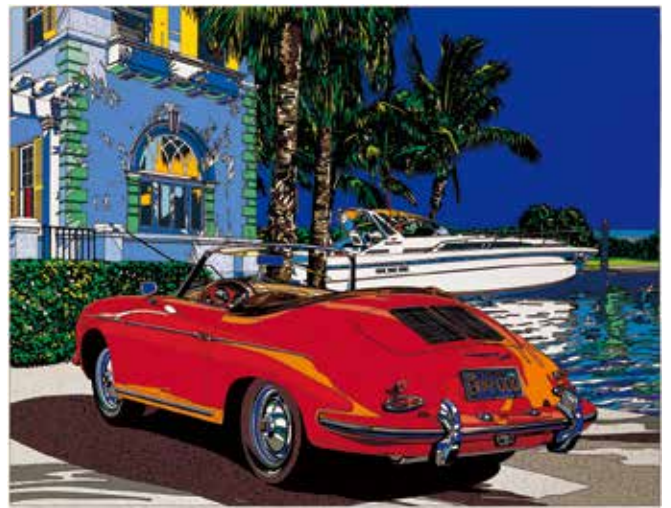
バリアス ドリームス (USAバージョン) 税込605,000円(52.3×67.3cm シルクスクリーン)