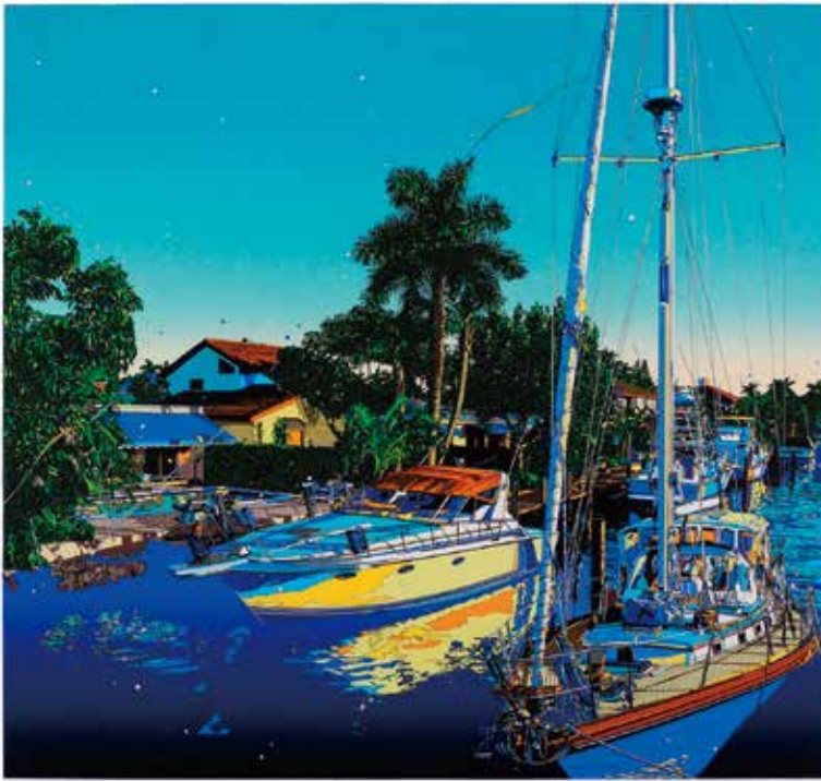
〈原画〉フロリダ人生 税込4,180,000円(64.1×67.1cm)