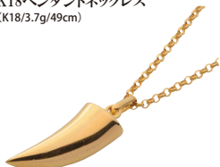
K18ペンダントネックレス (K18/3.7g/49cm)