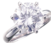
ダイヤモンドリング (PT/5.035ct GSI2 VG)