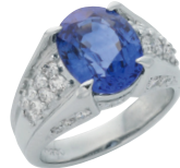
サファイヤ ダイヤモンドリング (PT/サファイヤ5.213ct/ダイヤモンド0.735ct)