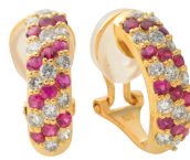
ルビー ダイヤモンドイヤリング (K18/ルビー0.8ct/ダイヤモンド0.76ct)