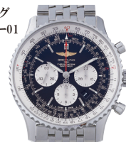
ブライトリング ナビタイマー01 (46mm AB0127/ A017B09NP)