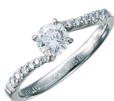
ダイヤモンドリング (PT/ダイヤモンド0.516ct 0.16ct HVV52 F/12号)