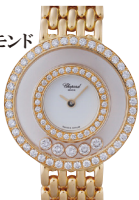
ショパール ハッピーダイヤモンド YG_2D・5P (205691-0001 YG/YG WT)