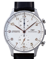
IWC ポルトギーゼ クロノグラフ (IW371401/ 革/SS/シルバー)