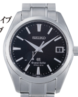
セイコー GS スプリングドライブ パワーリザーブ (SBGA003/ SS/SS BK)