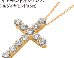
ダイヤモンドネックレス (K18/ダイヤモンド0.5ct)