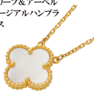
ヴァンクリーフ&アーペル ヴァンテージュアルハンブラ ネックレス (750)