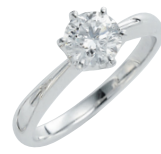
鑑定書付ダイヤモンドリング (PT/ダイヤモンド0.8ct D VV51 VG)