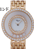
ショパール ハッピーダイヤモンド YG_2D・5P (205691-0001 YG/YG WT)