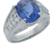
サファイヤ ダイヤモンドリング (PT/サファイヤ5.213ct/ダイヤモンド0.735ct)