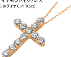
ダイヤモンドネックレス (K18/ダイヤモンド0.5ct)