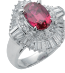
ルビー ダイヤモンドリング (PT/2.68ct 1.65ct)