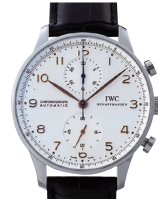
IWC ポルトギーゼ クロノグラフ (IW371401/ 革/SS/シルバー)