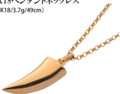
K18ペンダントネックレス (K18/3.7g/49cm)