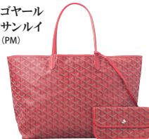
ゴヤール サンルイ (PM)