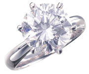
ダイヤモンドリング (PT/5.035ct G SI2 VG)