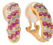
ルビー ダイヤモンドイヤリング (K18/ルビー0.8ct/ダイヤモンド0.76ct)