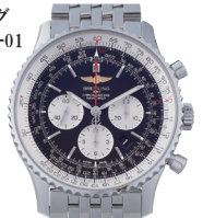
ブライトリング ナビタイマー01 (46mm AB0127/ A017B09NP)