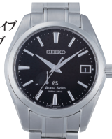
セイコー GS スプリングドライブ パワーリザーブ (SBGA003/ SS/SS BK)