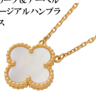
ヴァンクリーフ&アーペル ヴァンテージュアルハンブラ ネックレス (750)