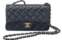
シャネル チェーンバッグ (69900/ラム)