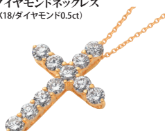
ダイヤモンドネックレス (K18/ダイヤモンド0.5ct)