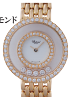
ショパール ハッピーダイヤモンド YG_2D・5P (205691-0001 YG/YG WT)