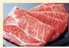
※ヒレ肉は除外させていただきます。 ※写真はイメージです。