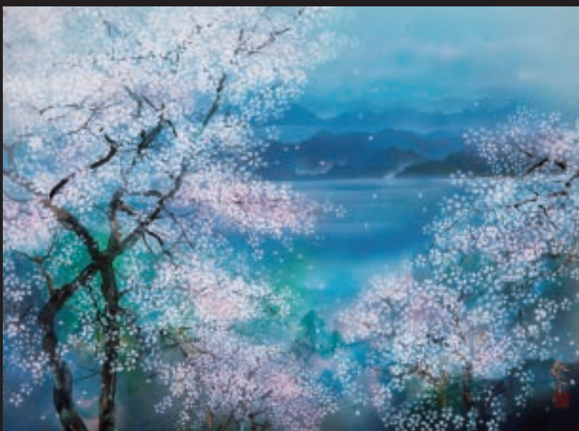
「瀬戸の春」(日本画、F10号)

[略歴] 1932年、宇和島市生まれ。京都市立美術大学(現・京都市立芸術大学)大学院を修了後、1961年渡米。前衛的な抽象画で注目を集める。帰国後は日本画に転向し、「日本百景」「四国八十八ヶ所霊場めぐり」「大津百景」など風景画の連作を収めた画集を刊行。一方で大覚寺、醍醐寺、東寺、伏見稲荷大社、上賀茂神社、石清水八幡宮などに襖絵や障壁画を奉納してきた。2000年密教学芸賞、2012年愛媛新聞賞受賞。滋賀県在住。